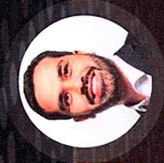
JORGE ÁLVAREZ MÁYNEZ